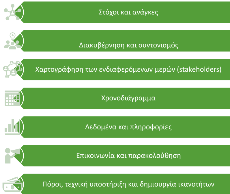
Διάγραμμα 1: Δομή Σχεδίου Αξιολόγησης

Το παρόν Σχέδιο Αξιολόγησης ετοιμάστηκε με βάση τις κατευθυντήριες γραμμές της ΕΕ, «Design of evaluation plan» που δημοσιεύτηκε τον Ιανουάριο του 2023.