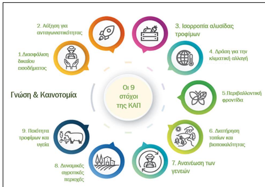
Διάγραμμα 2: Ειδικοί Στόχοι ΚΑΠ για την προγραμματική περίοδο 2023-2027

Επιπρόσθετες θεματικές αξιολογήσεις που θα υλοποιηθούν με βάση την λογική της παρέμβασης του ΣΣ ΚΑΠ θα αφορούν θέματα όπως: